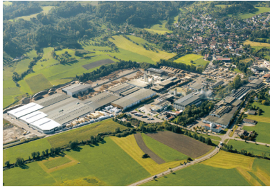
Binderholz Oberrot | Baruth GmbH Holzindustrie, Oberrot | D