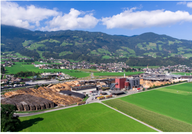
Binderholz GmbH Holzindustrie, Fügen | A