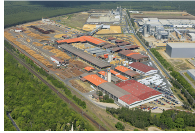
Binderholz Oberrot | Baruth GmbH Holzindustrie, Baruth | D