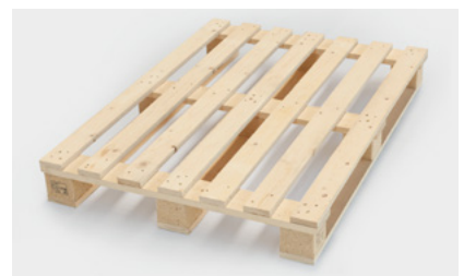
Paletten & Verpackungslösungen