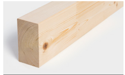
Konstruktionsvollholz & GLT®