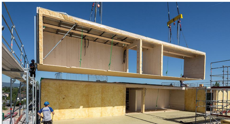
Großformatiger Modulbau mit SWISS KRONO LONGBOARD OSB (Bildnachweis: ERNE AG Holzbau | Raumwerk & Spreen Architekten Arbeitsgemeinschaft | Foto: Thomas Koculak)

Trotz des im Vergleich zu Spanplatten geringen Gewichts erreicht diese OSB-Platte eine sperrholzähnliche Biegefestigkeit. SWISS KRONO OSB/3 ist als luftdichte und diffusionshemmende Ebene in Holzrahmenbauten bzw. bei der Element- und Modulbauweise mit Holz verwendbar.