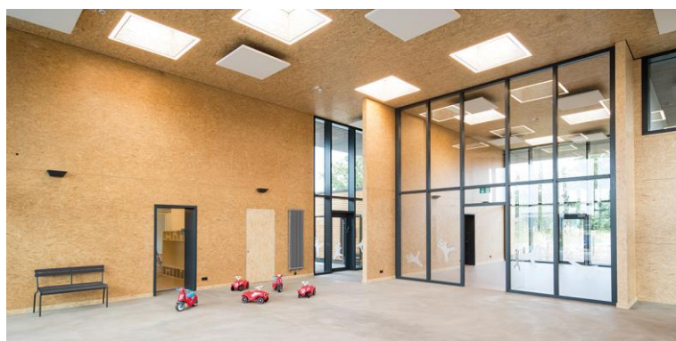
Eingangsbereich einer Kita mit sichtbaren SWISS KRONO OSB-Flächen

Seitens der verwendeten Baustoffe werden die QNG-Anforderungen mit SWISS KRONO OSB/3 und OSB/4 erfüllt – sogar für QNG-PLUS und QNG-PREMIUM. Mit einer Umweltproduktdeklaration (EPD), Blauem Engel und PEFC-Zertifikat ausgestattet, ist die formaldehydfrei verleimte SWISS KRONO OSB/3 ein Multitalent für alle tragenden und aussteifenden Bereiche.