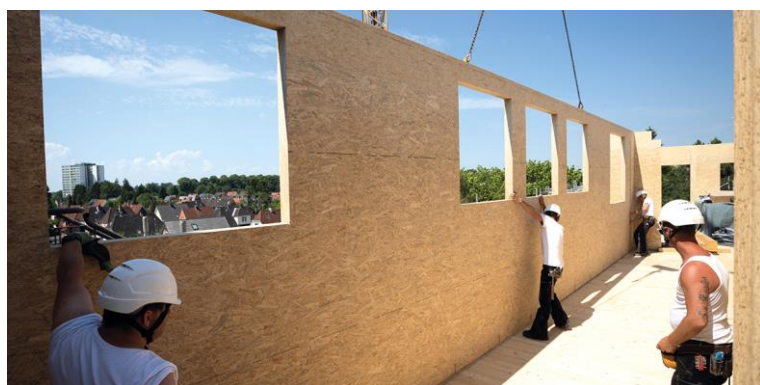
Fugenfreie Elemente bis zu 18 Meter Länge MAGNUMBOARD® OSB