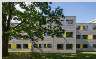
Verwaltungsgebäude (ERNE AG Holzbau)