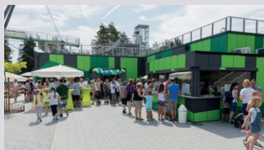
Restaurants (SWISS KRONO)