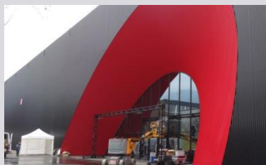
Messehallen (Messe Dornbirn GmbH)