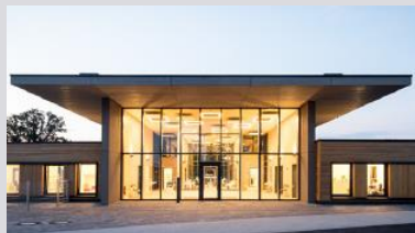
Kindertagesstätten und Schulen (SWISS KRONO | Foto: Jan Meier)