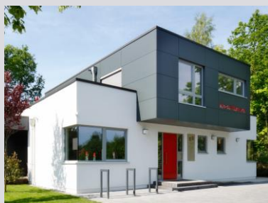
Arztpraxen (MAX-Haus GmbH | Foto: Daniel Wetzel)