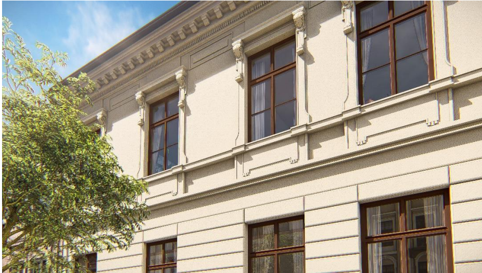
Historisierende Fenster von Gaulhofer in Manufakturqualität.

Gaulhofer, renommierter Hersteller mit über 100 Jahren Erfahrung im Fensterbau, bietet jetzt eine exklusive Linie historisierender Fenster, Kastenfenster, Fenstertüren und Haustüren speziell für denkmalgeschützte Gebäude. Diese werden in der hauseigenen Manufaktur in der Südsteiermark in Tischlerqualität produziert. Inklusive top Service für Planung und Beratung in historischen Projekten bzw. für den Denkmalschutz.