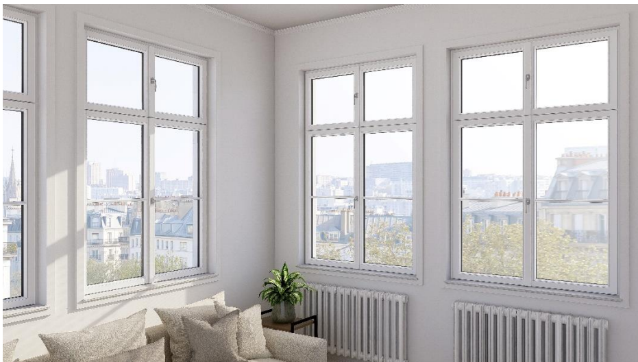
Denkmalschutzkonform in neue Zeiten

Mit modernster Technik und handwerklicher Präzision fertigt das Unternehmen Gaulhofer nun Fenster und Türen, die nicht nur den strengen Anforderungen der Denkmalpflege entsprechen, sondern auch höchste Standards im Wärme- und Schallschutz erfüllen. Besonderer Fokus liegt dabei auf der Verwendung einheimischer Hölzer und dem Erhalt historischer Designmerkmale wie eingezapften Sprossen und Zierelementen nach historischen Vorgaben.